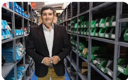
ADMINISTRACIÓN DE MATERIALES Y LOGÍSTICA