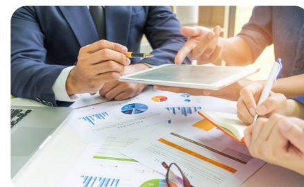
ANÁLITICA PARA LA TOMA DE DECISIONES EN LOS NEGOCIOS

El ITESO se reserva el derecho de apertura del programa en caso de no cubrir el mínimo requerido de participantes. El contenido de esta ficha se encuentra sujeta a cambios sin previo aviso.