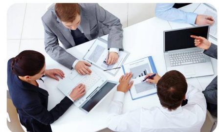
ESTRATEGIAS DE VENTA 5.0

El ITESO se reserva el derecho de apertura del programa en caso de no cubrir el mínimo requerido de participantes. El contenido de esta ficha se encuentra sujeta a cambios sin previo aviso.